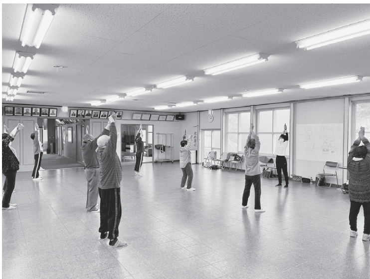
元気づくりシステムを活用し、高齢者の社会参加をサポート

町長 高齢者が社会参加をし、生きがいを持ち、心身ともに充実できる社会が出来ればと思っています。そのためにもサポートをしたいと思います。