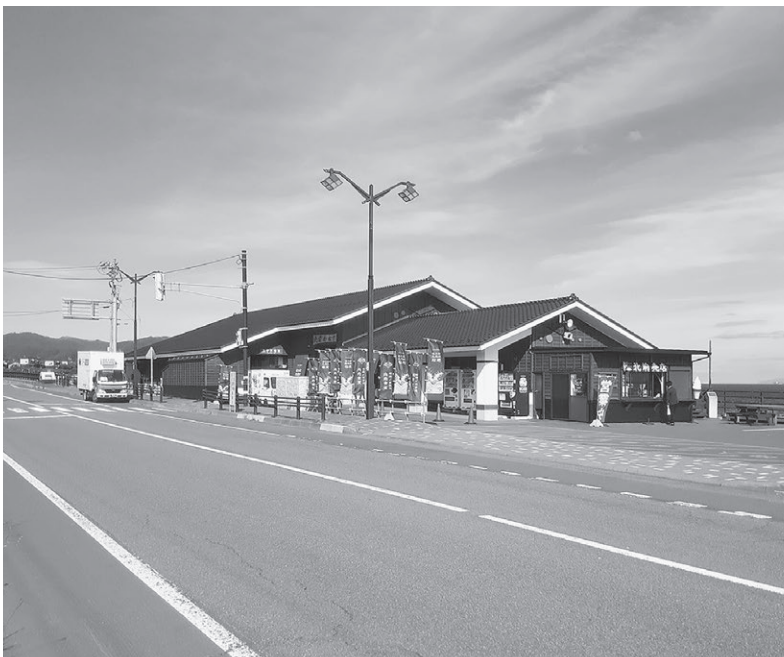
道の駅は引き続き海共舎が管理することに決まった

北前船記念公園総合管理施設(道の駅北前船松前)の指定管理者について、一般社団法人海共舎を指定することについて、審議の上原案どおり可決しました。