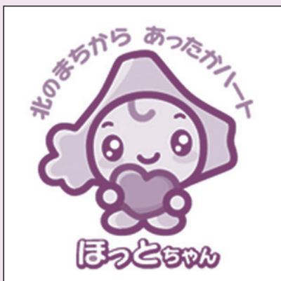
センターイメージキャラクター 『ほっとちゃん』