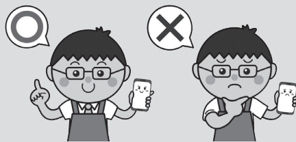
家族で話し合いフィルタリング