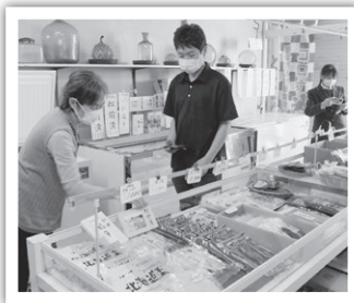
「松前町ガイドブック」 作成のための取材

また、ふるさとに密着した活動を大切にして、長年、多くの地元子ども達が通学し、愛されてきた「松前高校の今」、地域での『役割』や『魅力』を紹介します。