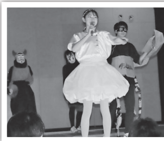
生徒が知恵を出し合い演出したパフォーマンスは見どころ満載でした。

今年の松高祭も新型コロナウイルス感染症防止対策を徹底して実施し、一般公開はできませんでしたが、様々な工夫をこらした生徒の熱い盛り上がりで思い出に残る行事になりました。