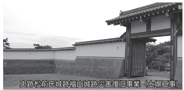
史跡松前氏城跡福山城跡災害復旧事業（土堀工事）