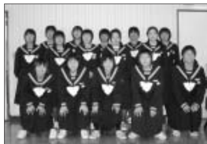
大島中学校女子ソフトボール部

「第22回北海道小学生陸上競技大会」において、小学4年生男子4x100mリレー、1分01秒80で第1位の成績を収めました。