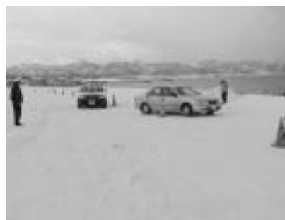
2月7日開催冬道の安全運転講習会

平成16年の物損事故について 最近、町内で交通事故による物損事故が多発しております。件数は特に冬期間の路面によるスリップ事故が最も多くなっております。また、年齢別に見ると30歳未満までが最も多く44%を占めております。道路別での発生率では国道が全体の約67%を占めるなど、死亡事故につながるような事故も、たくさんあります。交通ルールとマナーを守り事故をおこさないように注意しましょう。