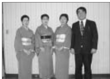
フォークダンスサークル

会発足以来10数年茶道の普及指導に努め、松前藩屋敷オープン時から催事や各種イベントの参加とともに国際交流の茶道体験などで町文化向上に大きく貢献されました。