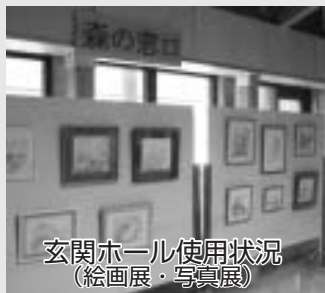
玄関ホール使用状況 (絵画展・写真展)