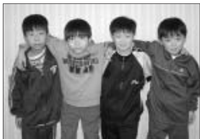
松前町陸上少年団 小学4年生男子リレーチーム

「第22回北海道小学生陸上競技大会」において、小学4年生男子800m、2分38秒76で第2位の成績を収めました。