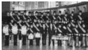
松前中学校吹奏楽部

「北海道マーチングバンド・パトントワリングフェスティバル」において銀賞を受賞されました。