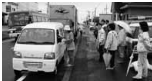
9月22日 江良女性ドライバーの会 江差信金職員による街頭啓発