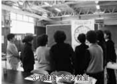
3月健康づくり教室