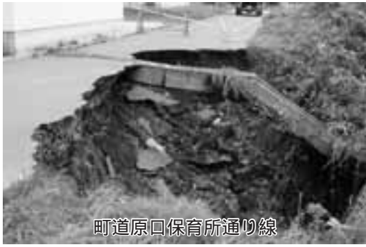
町道原口保育所通り線

また、8月29日には本町地区で、降り始めからの雨量88ミリ、1時間に最大60ミリと