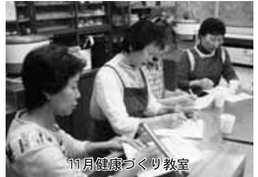
11月健康づくり教室