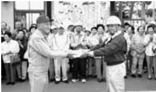
リストバンドを寄付する市川支店長(右)