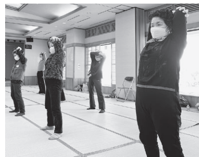
元気づくりシステム事業