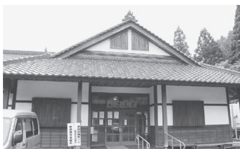
松前温泉休養センター