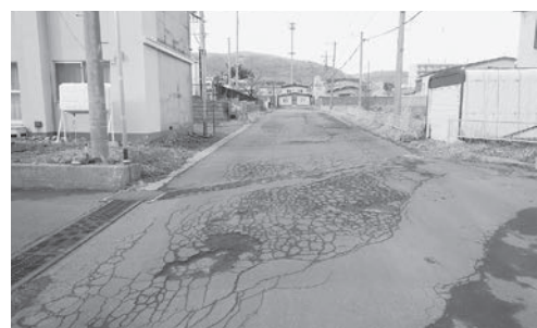
松前港北臨港道路