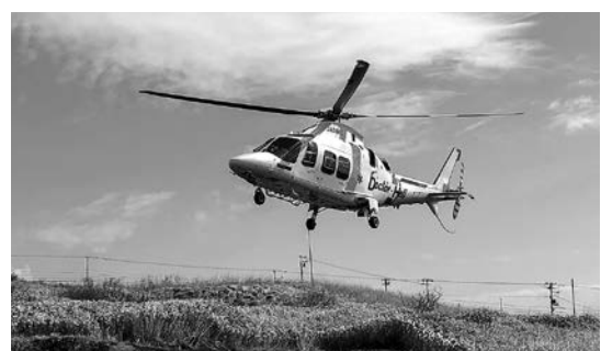
道南ドクターヘリ