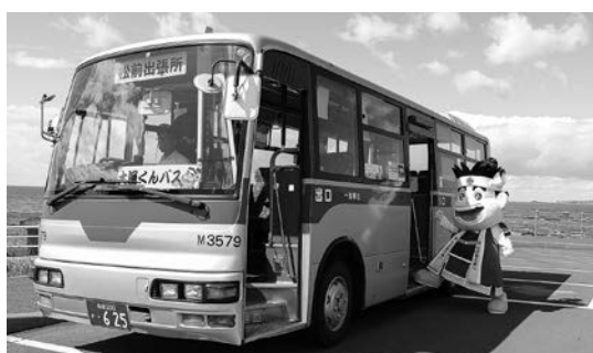
地域生活バス（大漁くんバス）