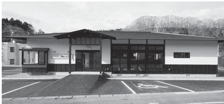
地域福祉交流センター「ゆいっこ」

ど試作品開発で付加価値をつけた商品化に取り組んでいるが、既に市場には同種の多数の商品があり、現状は厳しく、未だ本格的な販売には至っていない。未利用資源の開発、商品化は積極的に進めるべきであるが、開発商品にあつては町民に広く周知し、生産・販路拡大に繋げるべきである。