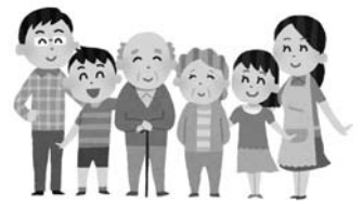
大切な家族のために

現在、松前町で検診を実施している5つのがん〔胃がん・肺がん・大腸がん・乳がん・子宮がん〕は、検診を受けることにより早期発見ができ、早期治療により死亡率が低下するがんです。