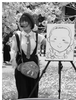
おえかきっこみゆ