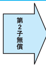
図1 2人目以降のお子さんの多子軽減のカウントの仕方が変わります。