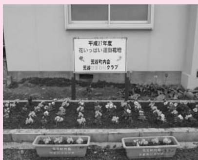
荒谷ひまわりクラブ