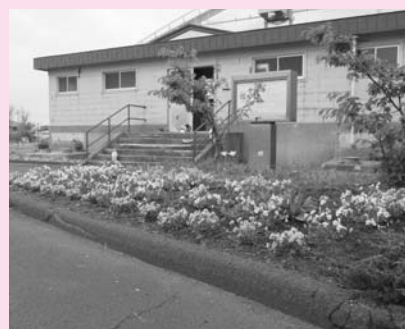
原口モノづくり女子会新真姫