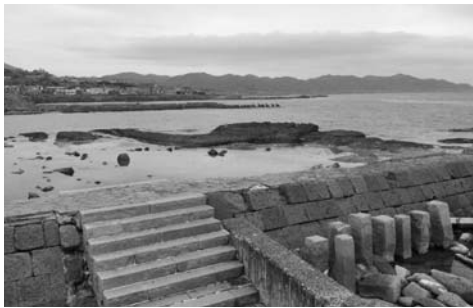
当時の名残を残す福山波止場

松前町でも、当時の遺構が残る「福山波止場」や、北前船が運んだ笏谷石 しゃくたにいし が使われている「松前藩主松前家墓所」、越前瓦がふかれた「龍雲院」など、北前船交易がもたらした様々な歴史文化財があります。