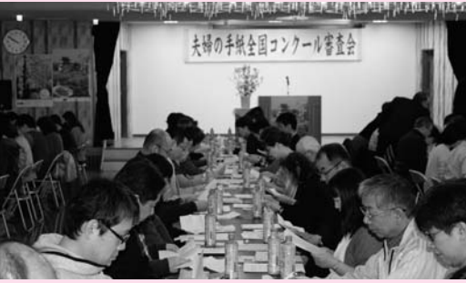
一枚一枚、丁寧に審査が行われました

なお、5月4日に夫婦桜前広場で行われる公開発表会で、優秀作品10点が松前高校生徒により朗読されます。(受賞作品は広報6月号に掲載します。)