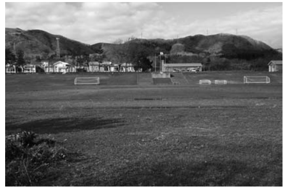
松前中学校グラウンド